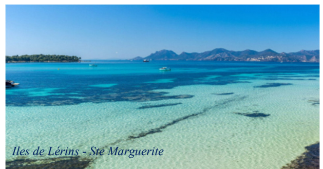
Îles de Lérins - Ste Marguerite