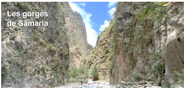
Les gorges de Samaria

On prendra plaisir à se perdre dans les ruelles de la vieille ville et éventuellement organiser une visite au sud de l'île, aux gorges de Samaria.