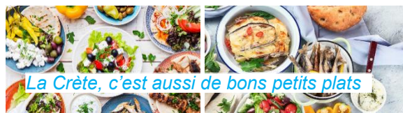
La Crète, c'est aussi de bons petits plats

Prenez vos dispositions pour rester en contact avec votre Chef de Bord et le GIC, en cas de modification, pendant les deux semaines qui précèdent le début de la croisière.