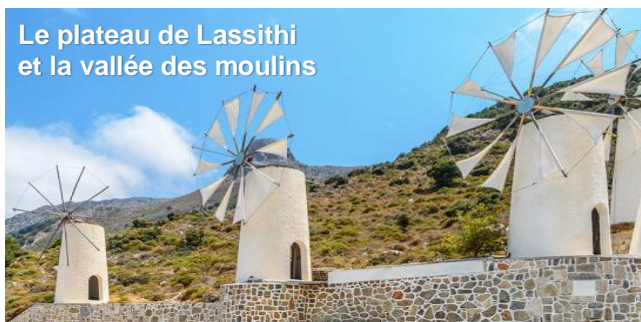
Le plateau de Lassithi et la vallée des moulins

Cette marina bien équipée donne accès à une ville dynamique et chaleureuse. On pourra compléter les approvisionnements et, si on le souhaite, organiser une visite de l'arrière-pays qui offre des sites renommés comme le plateau du Lassithi et la vallée des moulins.