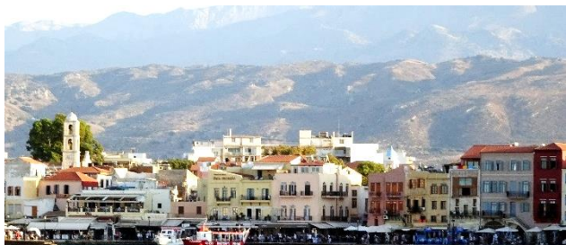
Le vieux port de La Canée

Le port mythique est bien protégé. Intégré dans la ville, il bénéficie d'une atmosphère très agréable. Réserver.