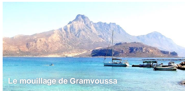
Le mouillage de Gramvoussa

Si les marges du planning n'ont pas été consommées, voici une option à 25 nm environ, d'un mouillage confidentiel dans la nature qui laissera un dernier joli souvenir avant de revenir à La Canée pour le débarquement.