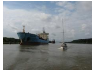
Dans le canal

Voie navigable de 98km, 100m de large, 13m de profondeur qui relie la mer du Nord à la Baltique néanmoins bucolique, elle est empruntée par de nombreux navires, cargos de plusieurs milliers de tonnes comme par des bateaux de plaisance.