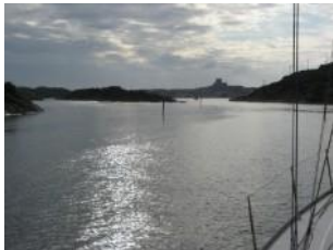
Arrivée sur Marstrand

La côte est rocheuse : une succession de dizaines d'îles et des chenaux qui permettent de naviguer plusieurs heures sans voir la mer. La navigation doit être très précise du fait des innombrables roches, souvent à fleur d'eau, qui pavent les chenaux. Chaque village de pêcheurs est très typé, a son propre caractère. Dans les archipels la culture « îlienne » est très marquée.